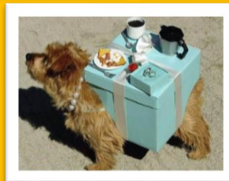
ティファニーで朝食を♪