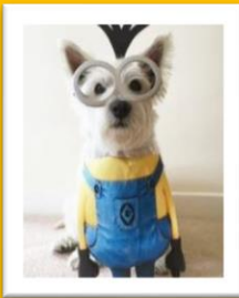
↑犬の業界でも大人気です！