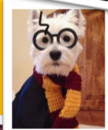
↑映画に出てそうです