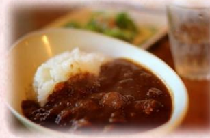
土・日・祝日限定の 本格派オリジナル カレーは絶品です！