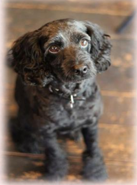
看板犬のMAC君 当店のトリミングの お得意様でもあります

八王子市大和田町にある、 隠れ家的カフェ。まるでお家の リビングで過ごしているかの 様。ワンちゃんと一緒にのんび りした時間とおいしい食事♪ 雨の日でも安心のワンちゃん店 内OKカフェです！！(但し時 間帯によります)運が良ければ かわいい看板犬、マック君にも 会えるかもしれません！ 歴代ピバドッグのスタッフ犬は 皆お世話になっています！ ワンコ大好きなオーナーさん と、犬話で盛り上がってくださ いね♪